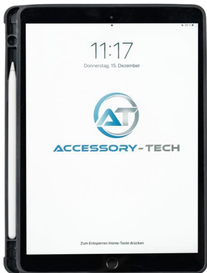
Innenliegender Stifthalter ✓

Eigenschaften: - Tastatur mit 78 Tasten - 14 Funktionstasten - QWERTZ Tastaturlayout - USB-C Ladeanschluss - Bluetooth 5 Verbindung - Standby Zeit bis zu 100 Tage - Nutzungsdauer bis zu 100 Stunden - Wiederaufladbarer Lithium Akku - Inklusive Ladekabel